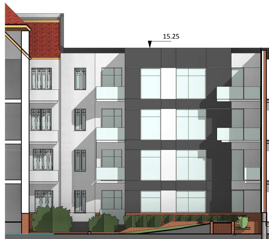
4 Elewacja południowa BŚ 36 1 : 200