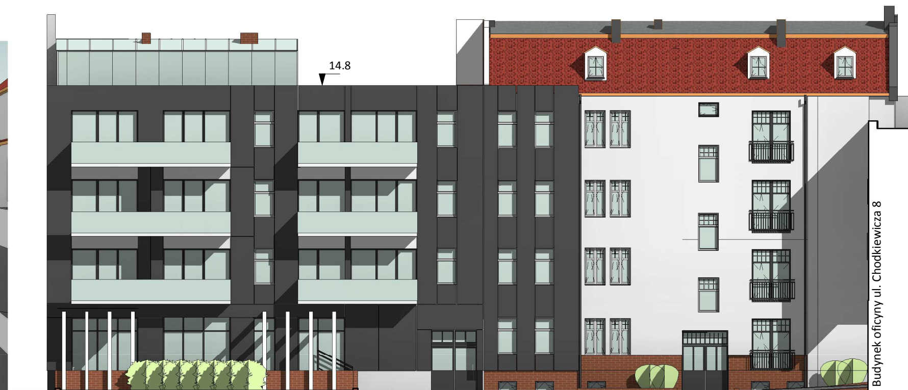
Kolorystyka elewacji i widoki 1 : 200