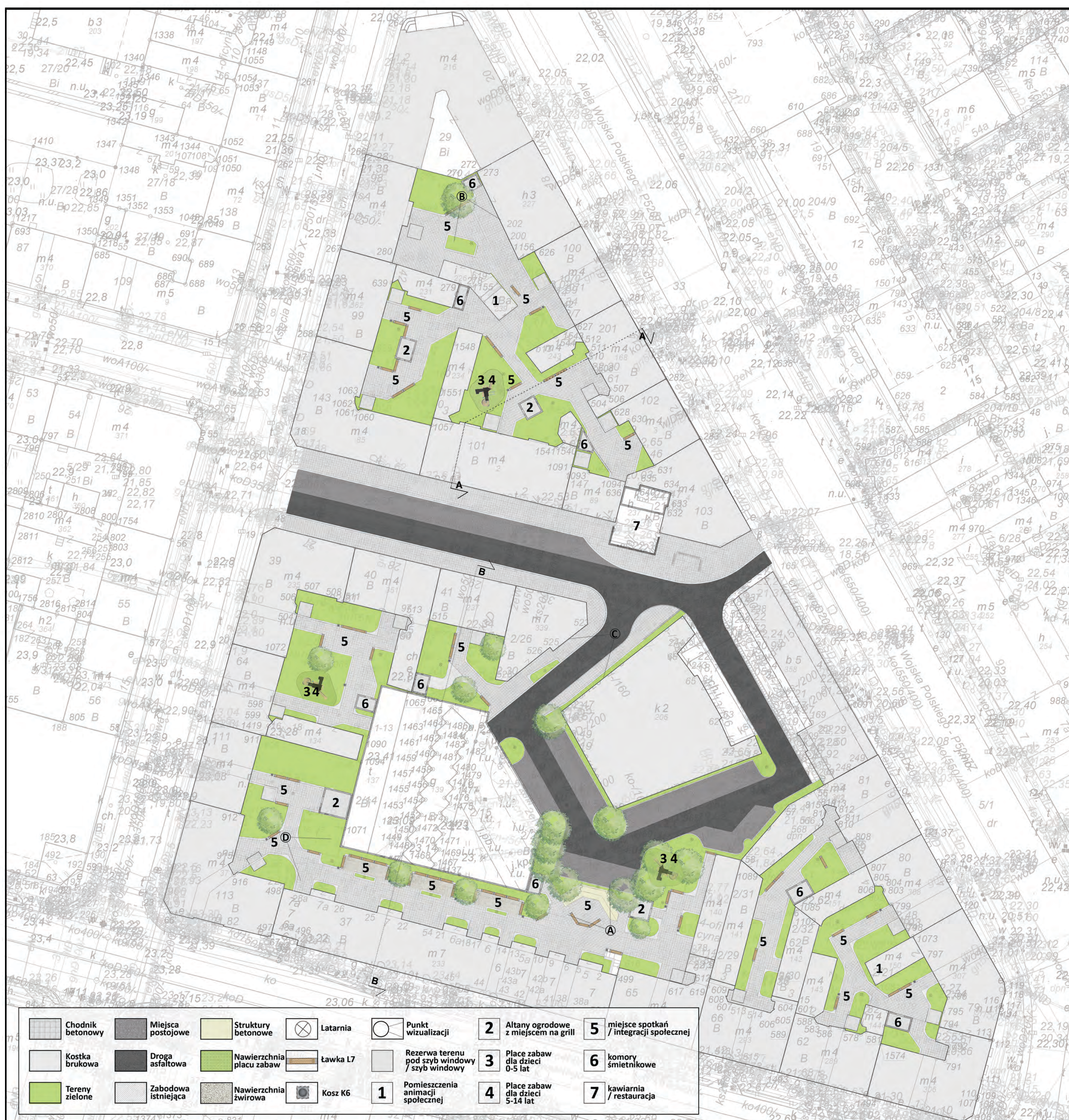
Koncepcja zagospodarowania – etap 1. skala 1:500